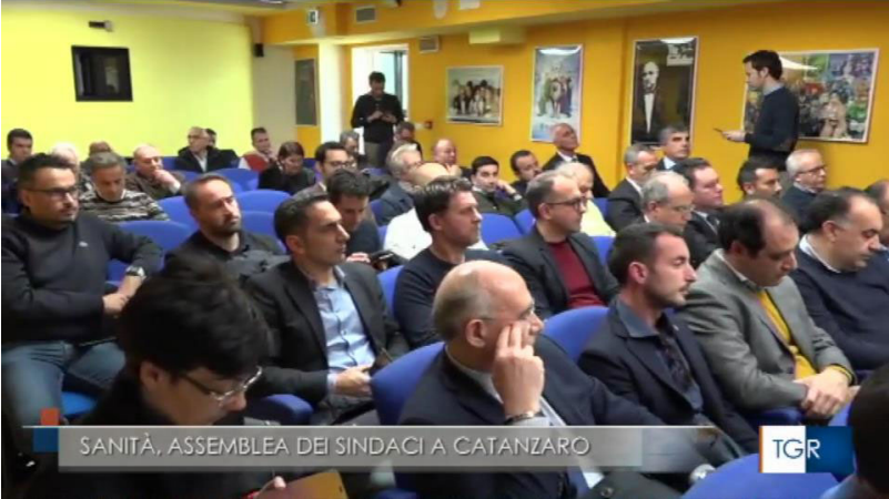
SANITÀ. ASSEMBLEA DEI SINDACI A CATANZARO

Assemblea dei Sindaci della Regione Calabria, 12 marzo 2020. L'assemblea si è svolta in videoconferenza.